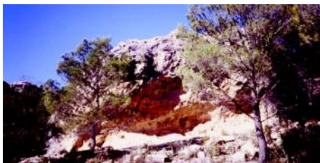
Cueva en el Cabezo del Moro.

de Yecla y la autovía Madrid-Alicante, limitando con Caudete, están las dehesas de Alcoy, Catín, Mojón Blanco y de Jódar.