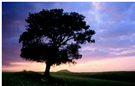
Amanecer en el encinar.