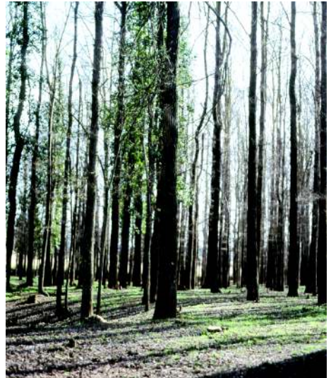
Chopera de la Casa de Ochoa, junto al Santuario de Belén.