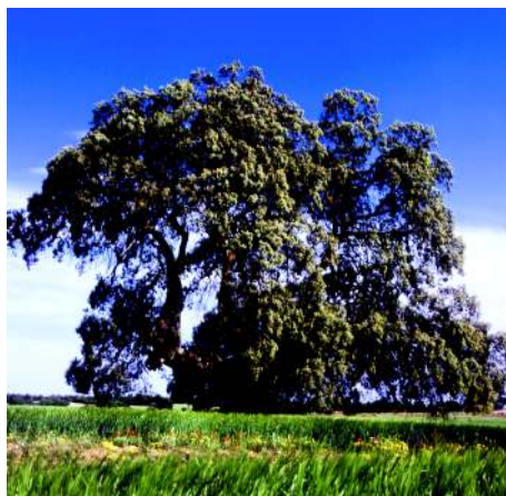
Encina en la dehesa de Botas.

El clima, mediterráneo de montaña, y la naturaleza del suelo, donde predominan las rocas de tipo calizo, van a condicionar el tipo de vegetación. Abunda el pino carrasco, que es sustituido por el pino negral en las zonas más altas y umbrías. También aparecen manchas de encina, enebro y coscoja más esporádicamente y en las cotas más altas sabinas. Por debajo del sustrato arbóreo, se desarrolla el sotobosque de especies típicas del matorral mediterráneo, con gran variedad de plantas aromáticas.