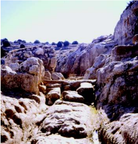
Camino tallado en la roca, que dá acceso a la ciudad íbera de Meca.

vestigios de una antigua civilización que pertenecen a una ciudad íbera denominada Meca, donde se han rescatado los restos de una torre romana, aljibes, viviendas, cerámica y un impresionante camino de carros excavado en la roca.