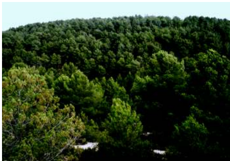
Pinada de la Sierra de Almansa

La zona noreste, conocida como Sierra de Almansa, se caracteriza por su altitud ya que se sitúa en ella el pico mas alto del término con 1.075 metros: el Pico Gallinero.