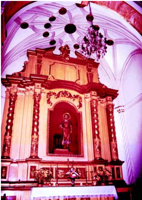
Capilla y retablo de San Crispín, con bóveda de crucería gótica.