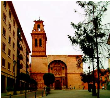
Exterior del ábside con sus contrafuertes de ladrillo.

En la cabecera de la nave, el ábside está formado por una bóveda de cuarto de esfera, que descansa sobre un entablamento sostenido por columnas corintias. Se piensa inspirada en la capilla del Palacio Real de Versalles. Exteriormente, se distingue por sus contrafuertes de ladrillo.