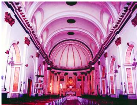
Nave central de la Iglesia de la Asunción, con el ábside al fondo.

La Iglesia Parroquial de Nuestra Señora de la Asunción muestra una amplia nave central con bóveda de cañón y capillas laterales entre contrafuertes coronados por cornisas y bolas de cantería. La fábrica es de mampostería, estando los contrafuertes en su cara externa rematados por sillares. Las capillas laterales conservan bóvedas de crucería y nervaduras.