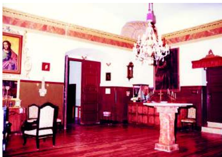
Interior de la Sacristía con el suelo original de madera y la curiosa «mesa» de reuniones

La Iglesia Parroquial de Nuestra Señora de la Asunción muestra una amplia nave central con bóveda de cañón y capillas laterales entre contrafuertes coronados por cornisas y bolas de cantería. La fábrica es de mampostería, estando los contrafuertes en su cara externa rematados por sillares. Las capillas laterales conservan bóvedas de crucería y nervaduras.