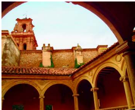
Torre de la Iglesia de la Asunción vista desde la Casa Grande.

En 1524 el concejo hizo todo tipo de gestiones para conseguir la edificación de un templo más grande.