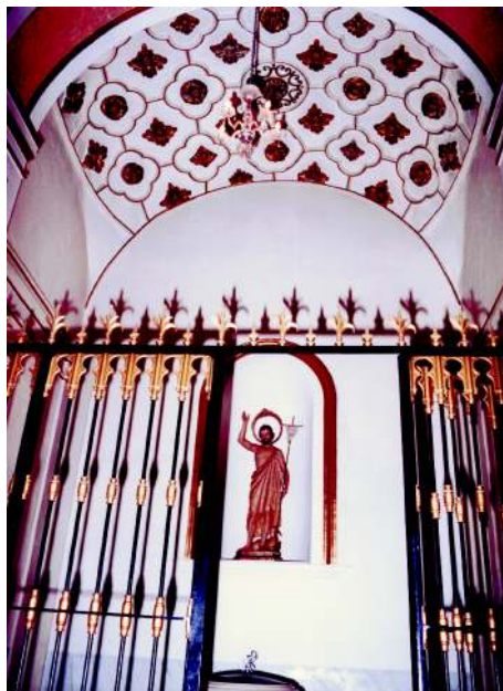
Capilla de San Juan Bautista, o del Baptisterio, con bóveda barroca.

La construcción de la Iglesia, como la mayor parte de las de la zona, abarcó un largo período de tiempo, en mayor medida debido a problemas económicos, a los que se han de sumar los ocasionados por el tipo de terreno en el que se sustentaban los cimientos, circunstancia que fue provocando sucesivos estados de ruina en el edificio.