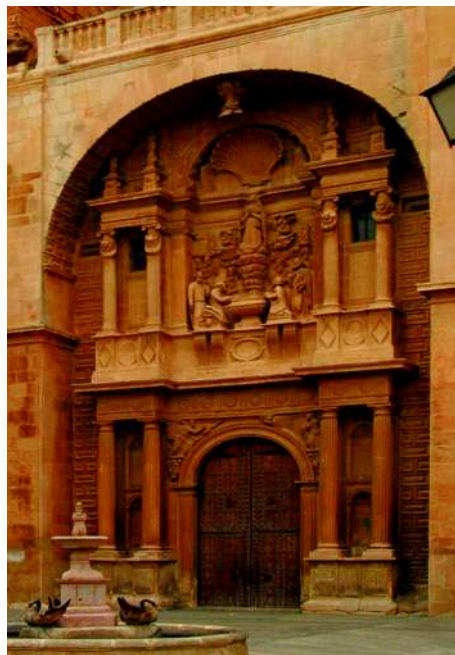
Fachada principal de la iglesia dividida en dos cuerpos, el inferior dedicado a la Anunciación y el superior a la Asunción.