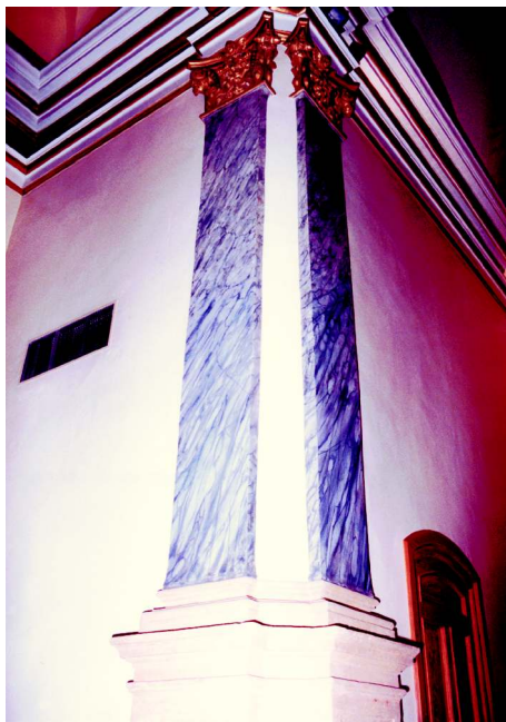
Columna y capitel restaurados en la Capilla de la Comunión.

En 1993 se acondicionó el interior de la iglesia, se pintaron la nave, las capillas y el ábside y se sustituyeron algunas baldosas de mármol del suelo. El friso se decoró en estuco verde vejiga y las columnas del presbiterio se estucaron imitando mármol rosa. Los capiteles se limpiaron y apareció su color dorado original.