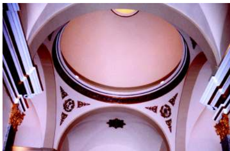
Detalle de la cúpula de la Capilla de la Comunión.