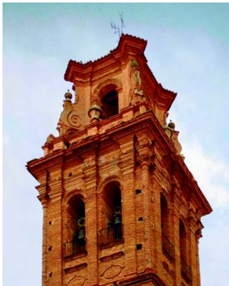
Detalle de la torre de ladrillo.

En su portada aparecen pilastras estriadas sobre basas, que soportan un friso con triglifos y metopas. Sobre la cornisa se presenta un frontón partido con una hornacina entre pilastras y volutas, que acoge un bajorrelieve de tema eucarístico. Este conjunto se encuentra rematado por otro frontón curvo con huecos lobulados a los lados.